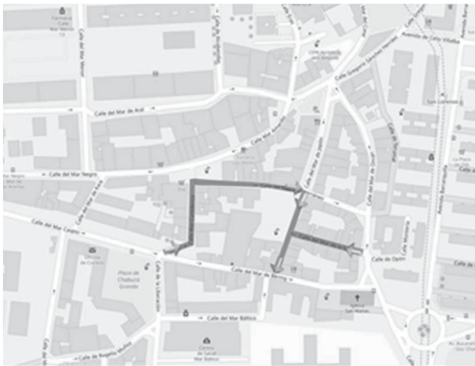
GRÁFICO ACCESOS VADOS Y CARGA Y DESCARGA