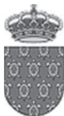
Figura nº 1. Escudo heráldico municipal de la Villa de Galapagar.

Art. 9. La representación gráfica del escudo heráldico municipal de la Villa de Galapagar, conforme a lo determinado en el artículo 8, se atenderá a lo especificado en la figura número 1.